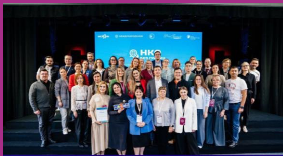
Завершение образовательного проекта «НКО без границ»