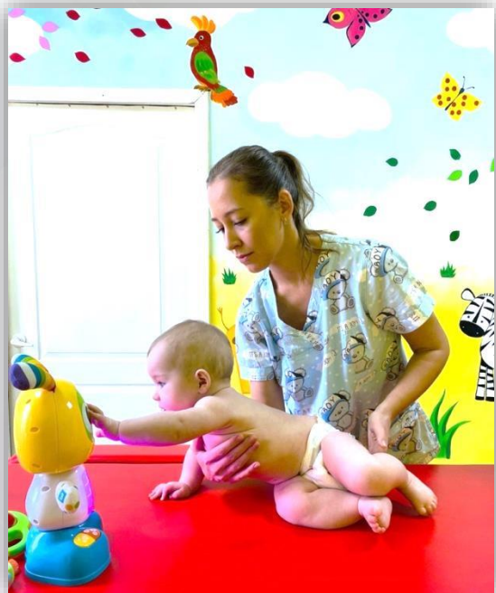
Способствуем выходу из положения сидя в положение на четвереньках

Развитие двигательной сферы оказывает значительное влияние на весь организм, и особенно на деятельность мозга: чем развитее двигательная деятельность, тем лучше речевая и психофизическая системы