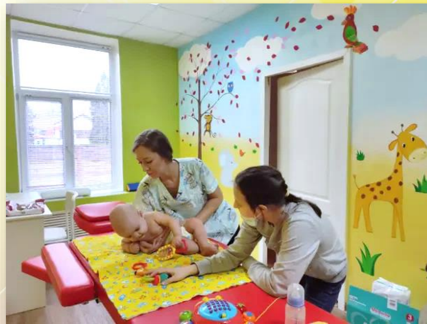
Учимся пребывать в гомолатеральной позиции (на боку)