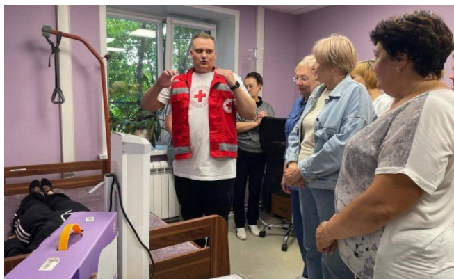
Практическое занятие по оказанию первой помощи