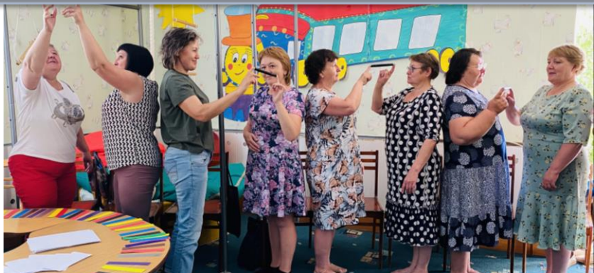
Психологический мастер - класс «Зарядись позитивом»