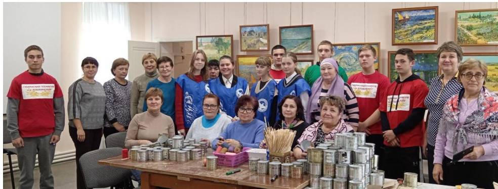
Участие корпоративных добровольцев в изготовлении окопных свечей

Развитие корпоративного добровольчества для повышения социальной активности социальных работников