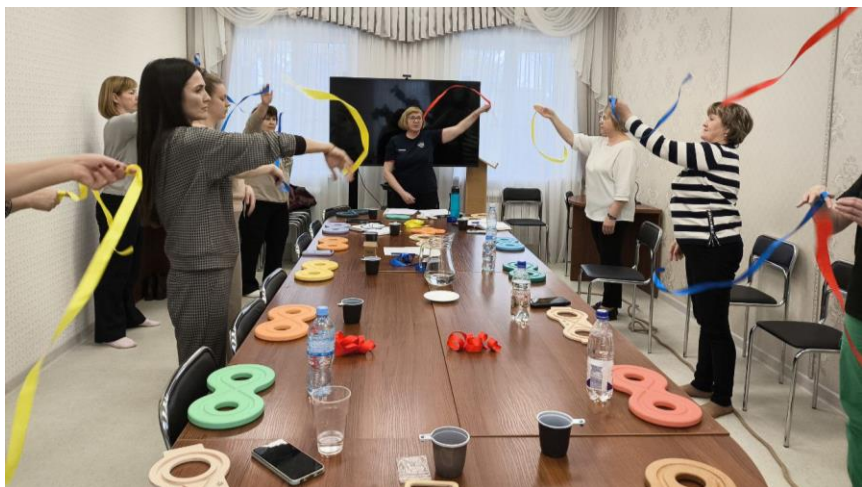
Семинар «Кинезиология. От стресса к гармонии»