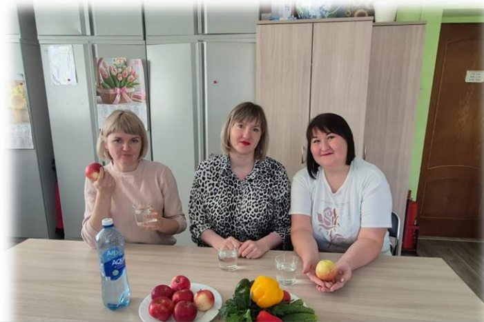
Первенство по снижению веса «ЖивиЛегче»