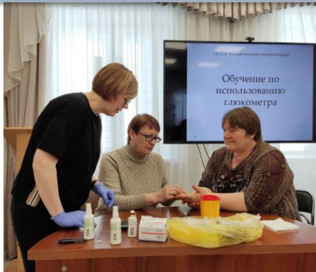
Выездной обучающий семинар медицинского колледжа