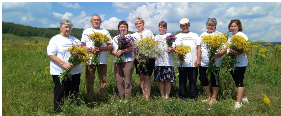
Корпоративное мероприятие для добровольцев «Пикник для здоровья!»