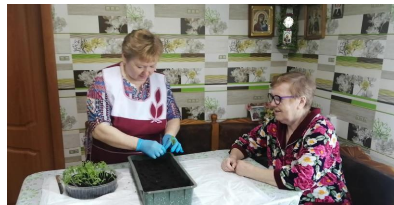
Участие добровольцев в благотворительной акции