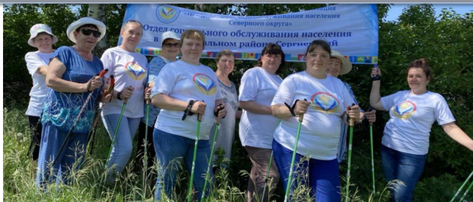
Лесные прогулки с палками для северной ходьбы

Организация и проведение с социальными работниками оздоровительных мероприятий