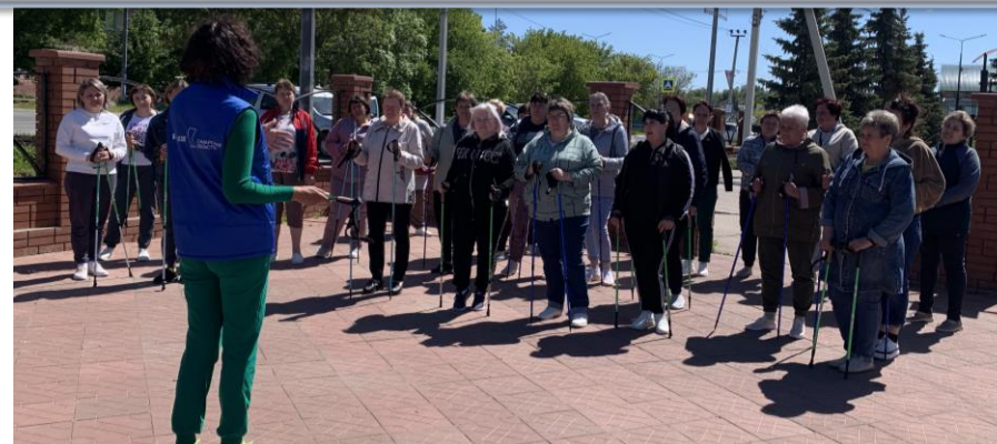
Мастер-класс по северной ходьбе