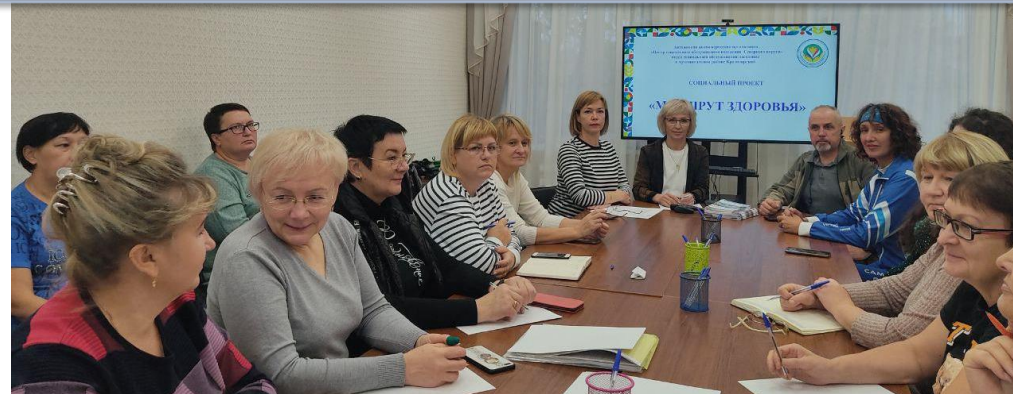
Мастер - класс по оздоровительной и северной ходьбе