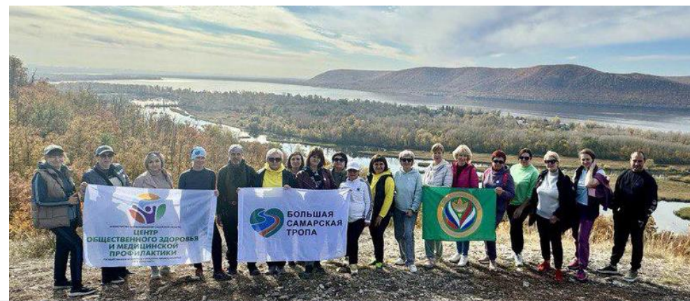
Пешая прогулка по большой Самарской тропе