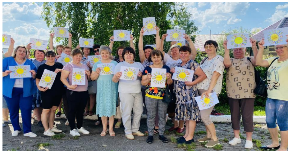
Мастер класс по арт-терапии