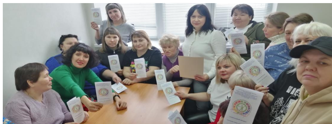
Обсуждение основных принципов здорового образа жизни