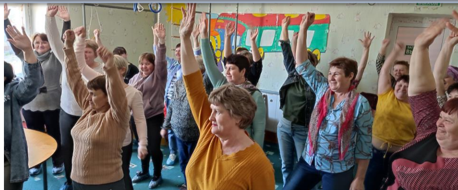
Тренинг по профилактике эмоционального выгорания