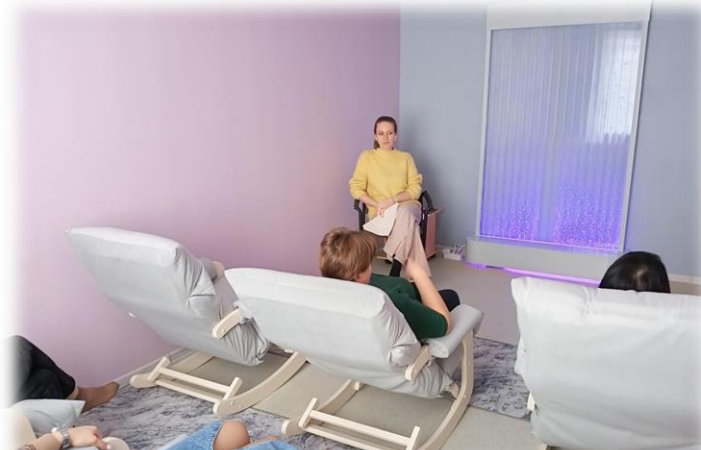
Сеанс релаксации для сотрудников