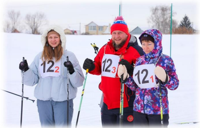
Лыжная эстафета «Лыжня России»