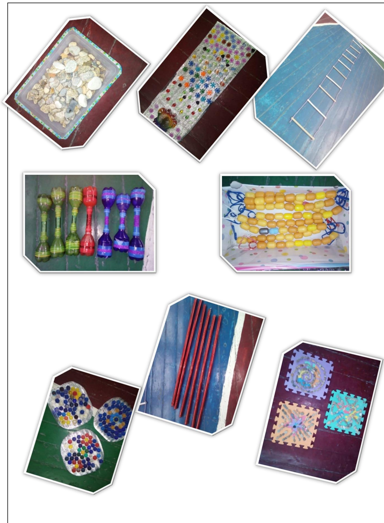
Рисунок.1. Использование нестандартного оборудования