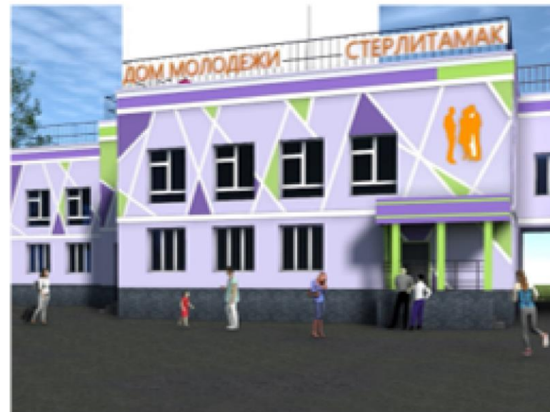
Реконструкция Дома молодежи

Указ Главы Республики Башкортостан от 5 июля 2024 года № РГ-318 «О номинациях на присуждение грантов Главы Республики Башкортостан «Достижение года» в 2024 году»