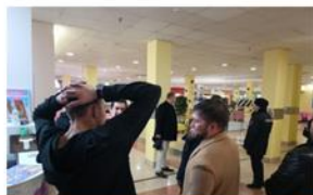
Профилактические рейды в торговых центрах