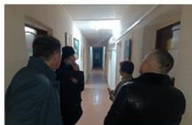
Профилактические рейды в общежитиях