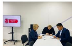
Горячая линия «Сообща, где торгуют смертью»