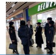
Проект «Подросток в торговом центре»