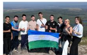
Проект «КОНТАКТ 02»