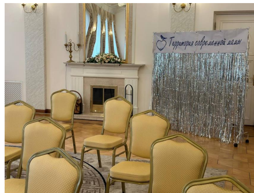
Фото с мероприятий проекта