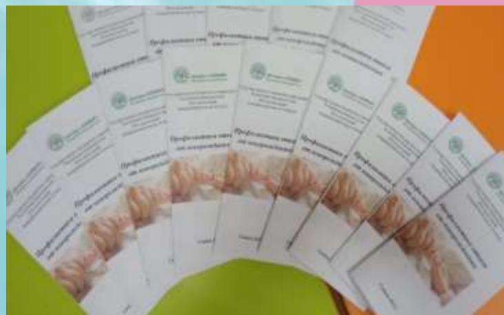
Буклеты по профилактике отказа от новорожденных