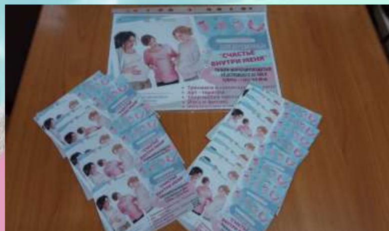
Листовки школа беременных «Счастье внутри меня»