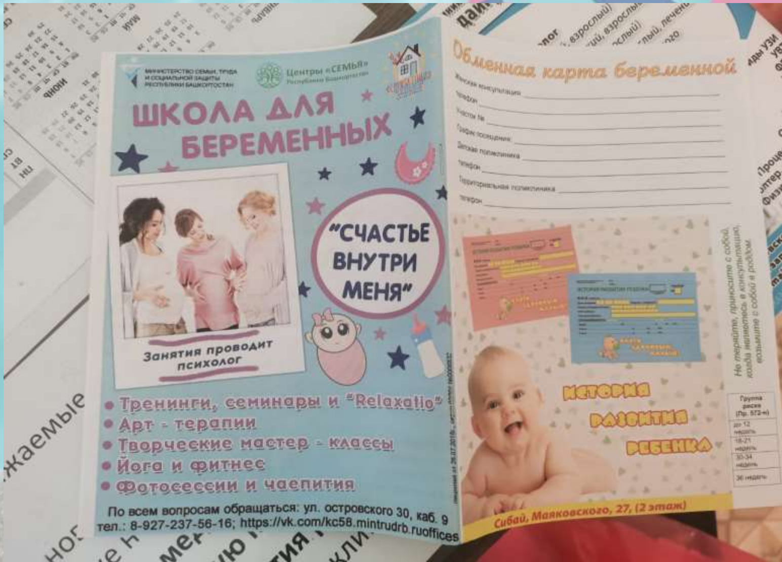
Реклама школа беременных «Счастье внутри меня» в обменных картах беременных г.Сибай Республика Башкортостан