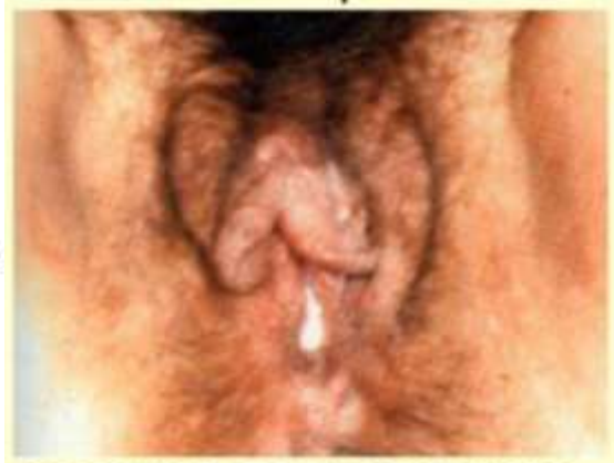
Выделения из влагалища при гонорее.