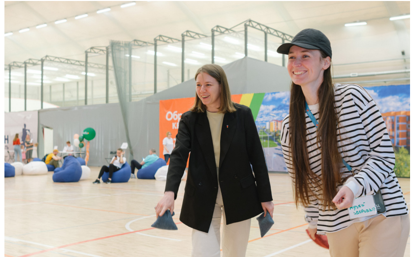
День здоровья для семей сотрудников аэропорта Пулково, 2024

Курс «Экстренная помощь» для сети клиник «Лахта-центр», 2022