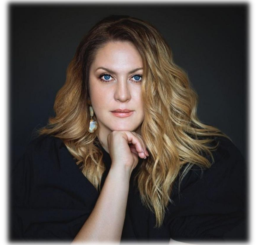
Ольга Шестакова фотограф проекта.