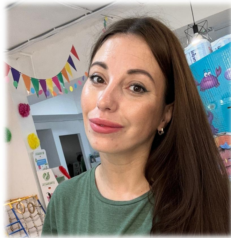
Марина Тиунова Фото-, видеосъемка