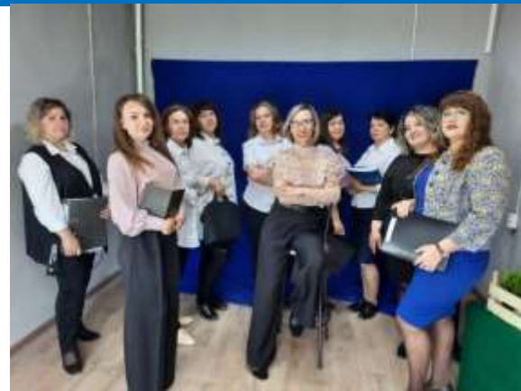
Служба семьи в г. Сибай