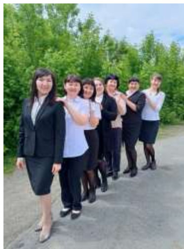
Служба семьи в Хайбуллинском районе