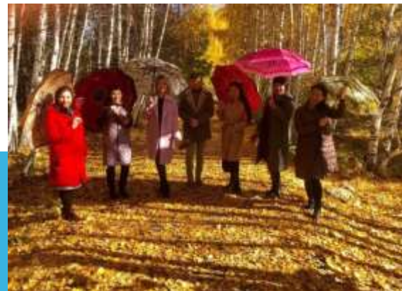
Служба семьи в г. Баймак