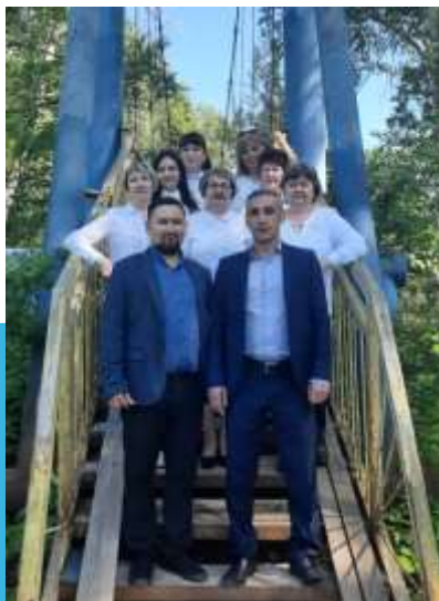
Служба семьи в Зианчуринском районе