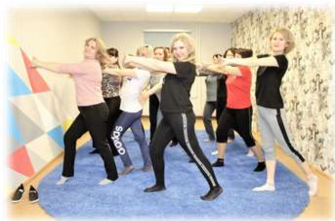
Организация физкультурных минуток в подразделении