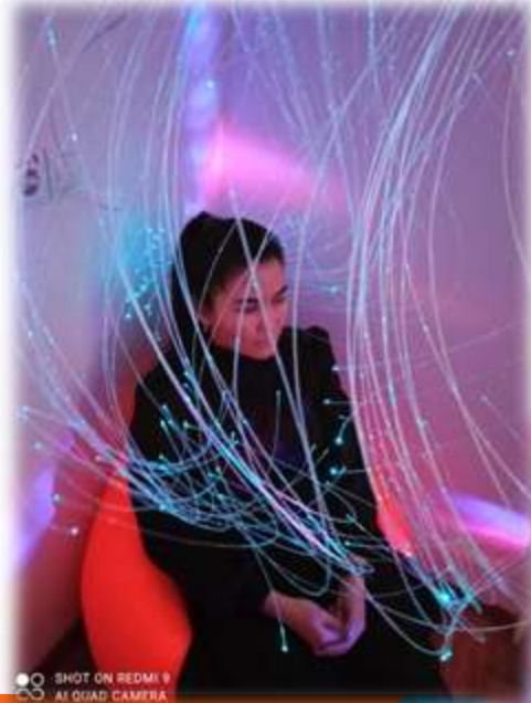
Посещение сенсорной комнаты сотрудниками