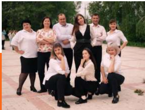
Служба семьи в Зилаирском районе