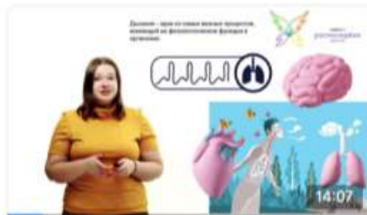
ДЫХАТЕЛЬНАЯ ГИМНАСТИКА Профессиональный житель планеты 597 просмотров · 1 месяц назад