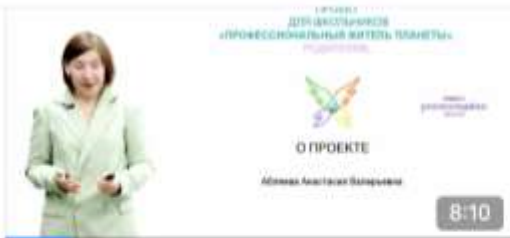
О ПРОЕКТЕ Профессиональный житель планеты 689 просмотров · 1 месяц назад