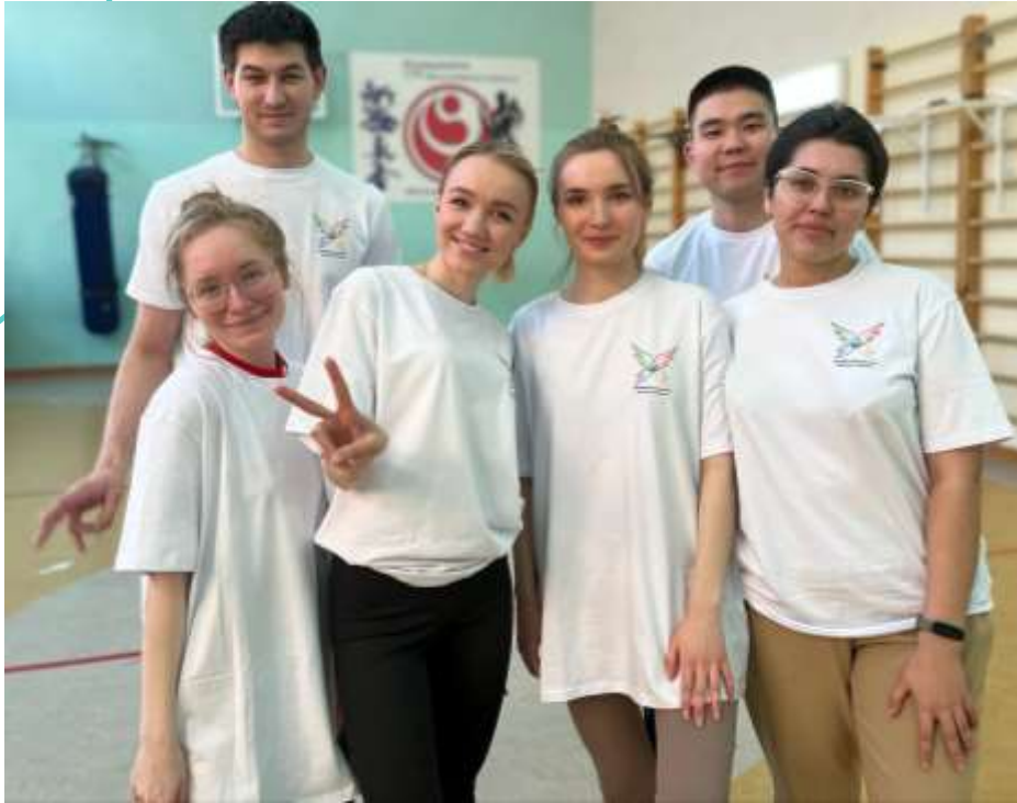
Профильное обучение по гигиеническому воспитанию и обучению