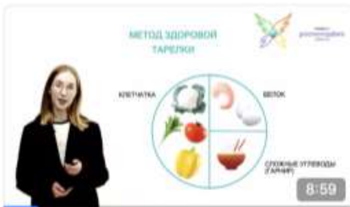
КОНСТРУКТОР ПИТАНИЯ Профессиональный житель планеты 547 просмотров · 1 месяц назад