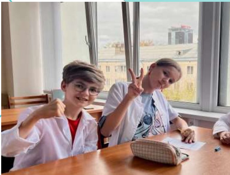
Интерактивные игры на уроках