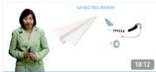
ИНВЕСТИЦИОННЫЙ ПОДХОД К ЗДОРОВЬЮ Профессиональный житель планеты 674 просмотра · 1 месяц назад