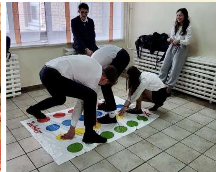
Подвижные игры на переменах