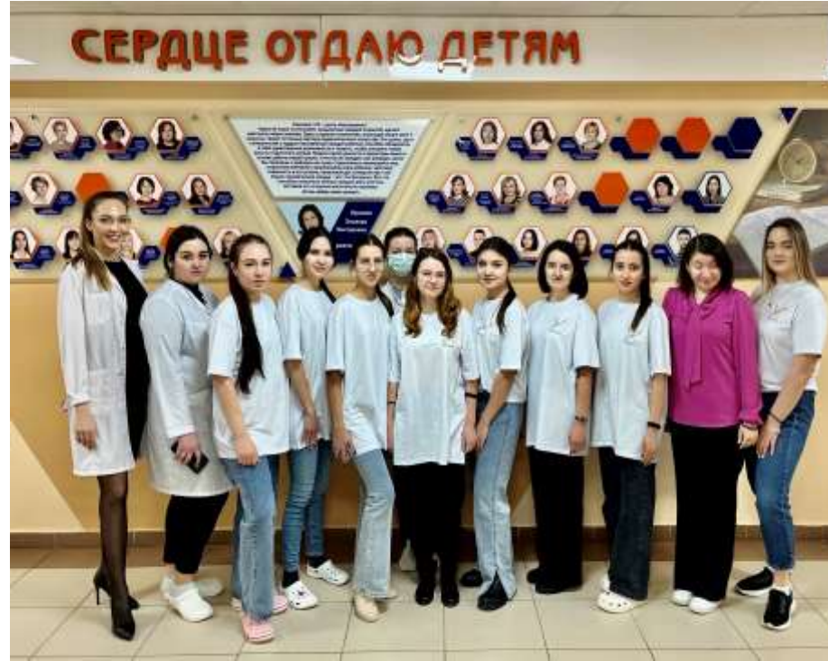
Амбассадорство Международной ассоциации здоровья подростков