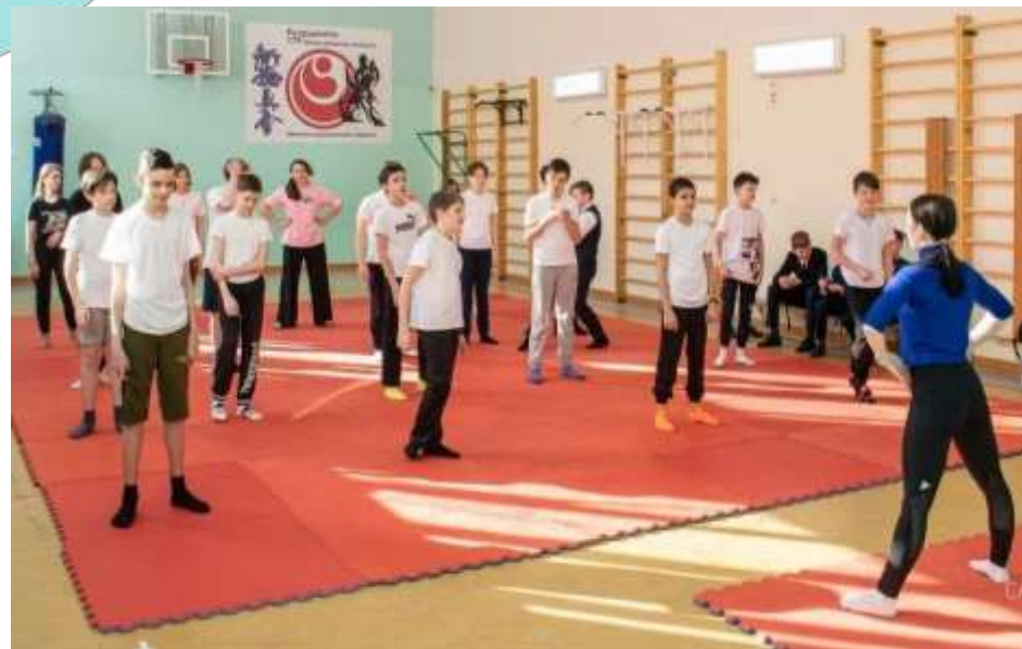
Йога на уроках физической культуры