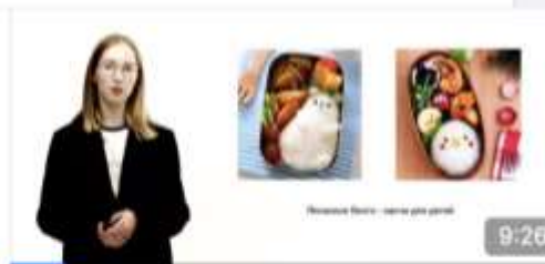
ЗДОРОВЫЕ ПИЩЕВЫЕ ПРИВЫЧКИ Профессиональный житель планеты 577 просмотров · 1 месяц назад